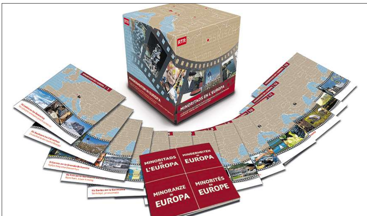
Uschia sa preschenta la boxa cun ils 13 films ed il cudeschet accompagnant.

Juf sin 2126 m. s. m è la fracziun tipica da Gualsers la pli auta da l'Europa ch'è abitada l'entir onn. Ils Gualsers han savens stuì colonisar las regiuns autalpinas las pli isoladas, selvadias e stippas, nua ch'igl aveva anc in zic spazi abitabel. Avant radund 700 onns en ils Gualsers emigrads dal Vallais Sura vers l'Italia ed il Tessin ed en arrivads en il Grischun, nua ch'i dat anc oz 15 regiuns gualsras. In tratg caracteristic dals Gualsers è lur lingua alemana ch'è sa sviluppada vivan en contact cun ils vischins rumantschs e talians. Il gualser n'è nagina lingua da scola, ma ella vegn tgirada cun quità en la famiglia ed en la cuminanza. En las Alps Centralas sa decleran radund 10 000 persunas sco Gualsras.